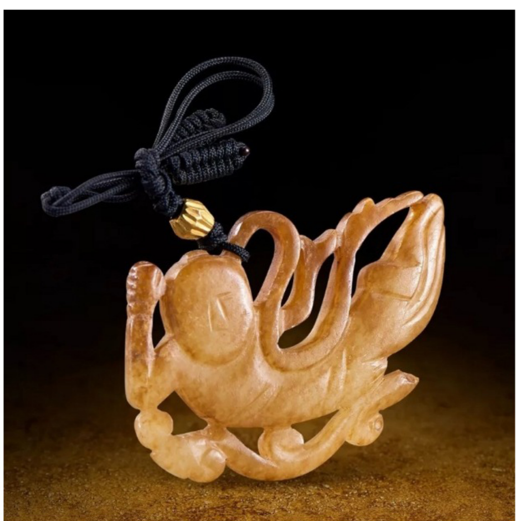
拍賣品 6318 白玉帶紅心「飛天」 遼金

拍賣品預展現場將於5月29日起一連兩天於香港萬麗海景酒店舉行，並重點展出以下珍品：新石器時代紅山文化代表性的「玉豬龍」、遼金時代的白玉帶紅心「飛天」和清乾隆御製白玉「平定合符」；中國書畫方面將展出「中國現代繪畫之父」林風眠先生的《晨曲》，該作品是二十世紀初華人藝術家以自身風格融入西方現代主義的代表作品；在佛教造像拍賣上，萬昌斯展現出其超群實力，將推出明正統銅鑲金寶冠釋迦牟尼和遼銅佛板等稀世珍品。