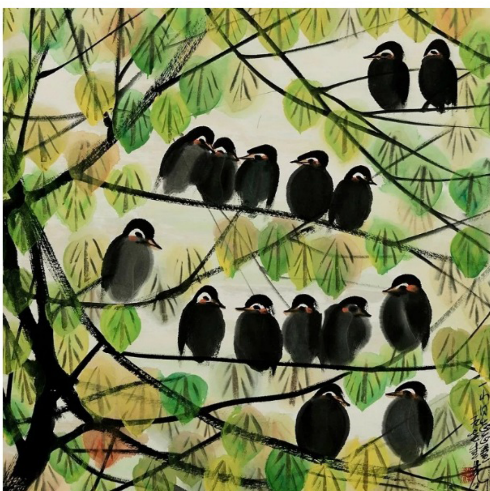
拍賣品 6048 晨曲 林風眠(1900-1991)