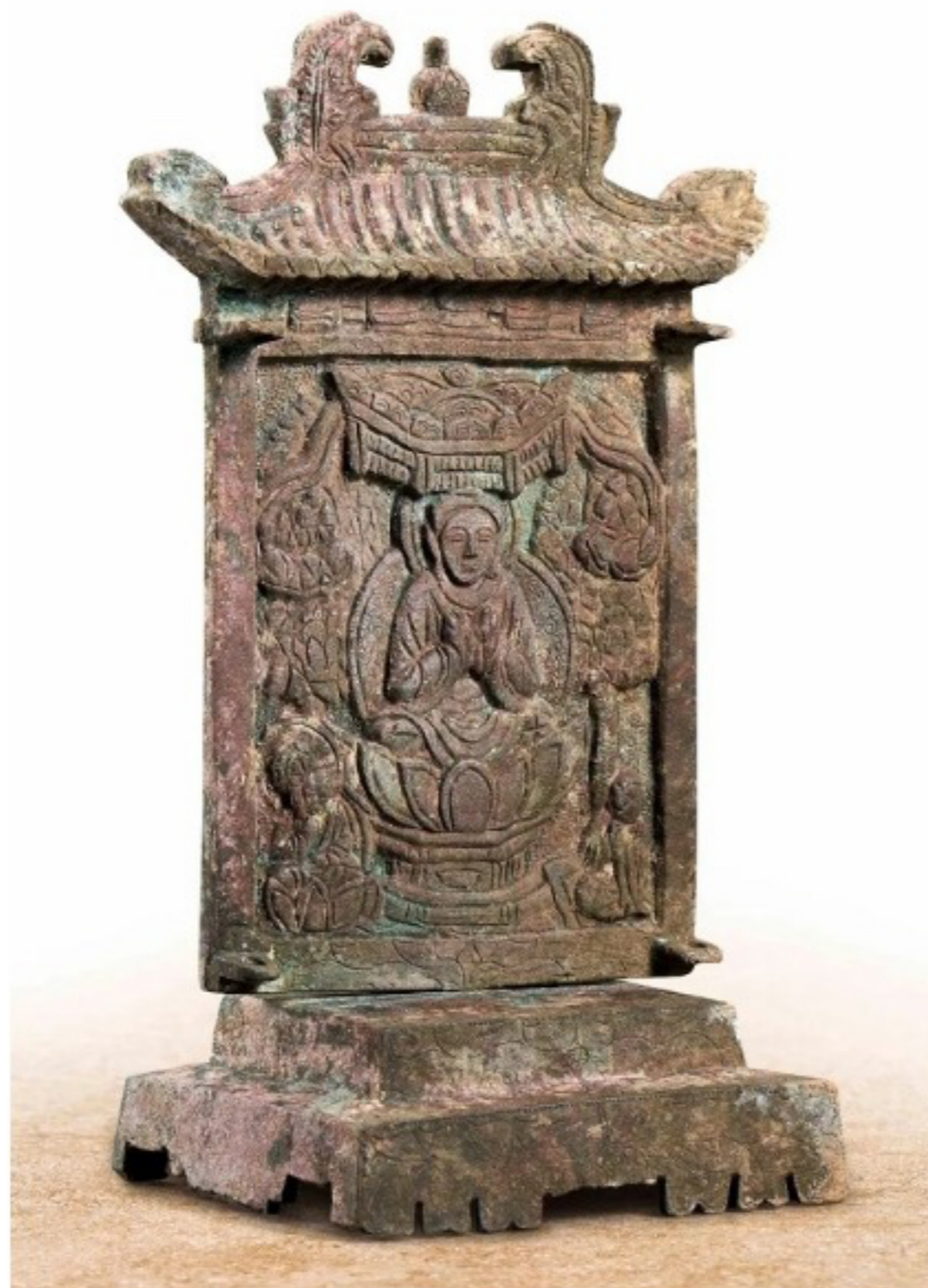
拍賣品 6764 銅佛板 遼

明正統銅鑲金寶冠釋迦牟尼是明朝宮廷佛教藝術登峰造極的藝術珍品，而遼銅佛板則是全球銅制佛板中最大的一件珍品；古董珍玩方面，清雍正御制門彩「龍」紋盤和南宋建盞「油滴天目」則將成為矚目焦點。