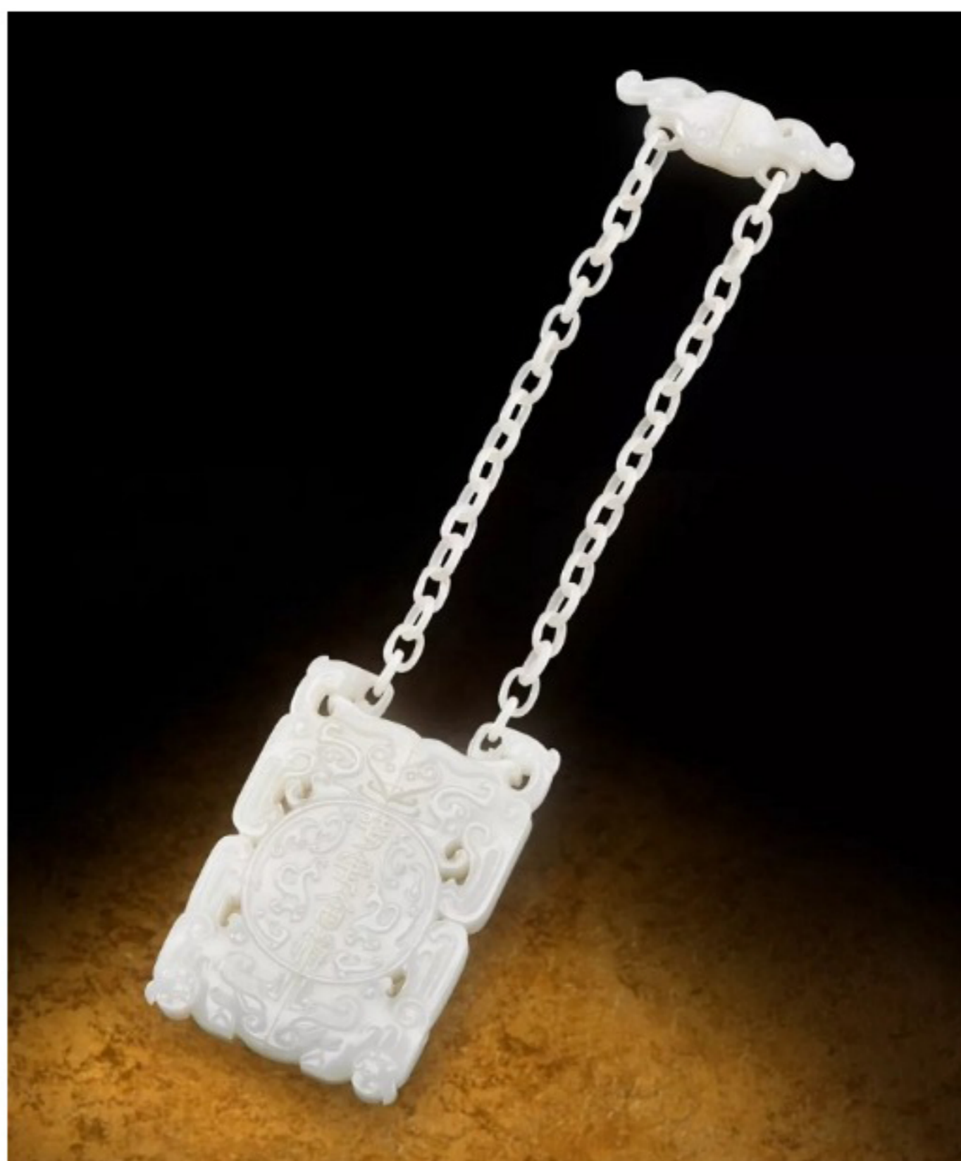
拍賣品 6513 御製白玉「平定合符」 清乾隆

是次春拍不但呈獻多個中國古玉，重點拍賣品更包括由新石器時代的紅山文化至清朝乾隆時期的中國歷史文化藝術品。萬昌斯憑藉其專業及雄厚實力在全球搜集超過600件藝術品，如中國中高古玉器、中國書畫、佛教藝術造像及中國古董珍玩等，總價值超過港幣4千萬。