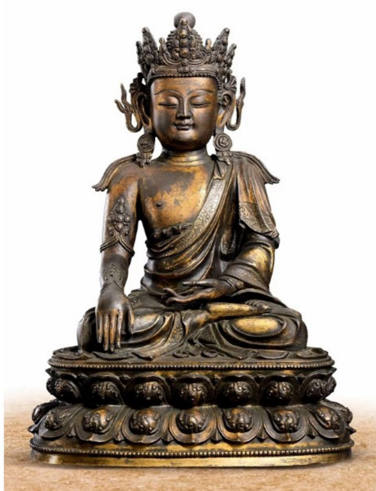
拍賣品 6730 銅鑲金寶冠釋迦牟尼 明正統

明正統銅鑲金寶冠釋迦牟尼是明朝宮廷佛教藝術登峰造極的藝術珍品，而遼銅佛板則是全球銅制佛板中最大的一件珍品；古董珍玩方面，清雍正御制門彩「龍」紋盤和南宋建盞「油滴天目」則將成為矚目焦點。