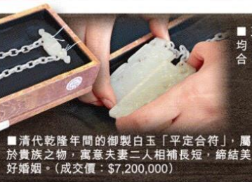
■玉匾及玉牌均以榫位接合，雕工超卓。