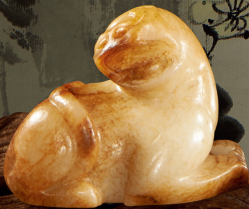
汉 白玉「咆哮」虎王 长 5 cm (2 in)