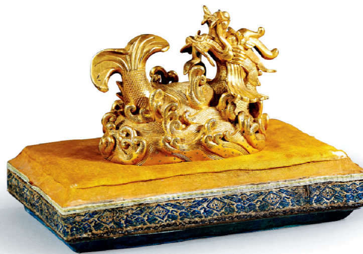
清乾隆 御制铜鎏金鱼化龙纸镇连布座 长11.8 厘米

汉代玉雕动物动态十足，是高古玉器中的经典一环。汉代白玉“咆哮”虎王，取上乘白玉，圆雕成卧虎张口咆哮状，不怒而威，造型独特。最为难得的是玉虎口部的仔细刻画，不但上下两排虎齿颗颗清晰可见，虎舌向外伸出翘起，就连上颚的肌肉纹理也用阴线刻出，逼真传神。此玉虎是台湾著名藏家吴之方旧藏，于1990年《中国文物世界》出版，估价亦相当吸引目光，相信将为本场拍卖掀起一轮高潮。