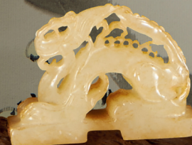
元 白玉带沁「坐龙」钮双联印 长 3.6 cm (1 3/8 in)