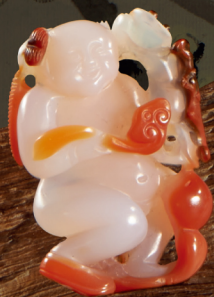
清乾隆 御制南红玛瑙巧雕「刘海」 《乾隆御玩》款 长 4 cm (1 5/8 in)