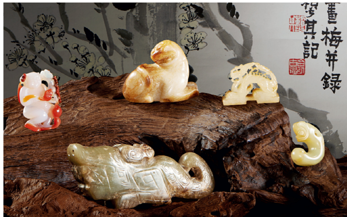
上左：清 乾隆 御制南红玛瑙巧雕“刘海”“乾隆御玩”款 长4厘米 上中：汉 白玉“咆哮”虎王 长5厘米 上右：元 白玉带沁“坐龙”钮双联印 长3.6厘米 下左：商 玉夔龙 长9.5厘米 下右：红山文化 玉猪龙 长 2.7厘米 字画：赖少其《山中晴雪》 56厘米x 135 厘米

预展时间 5月29日至31日 拍卖时间 6月1日 展览地点 香港上环皇后大道西二二号 华富商业大厦2楼