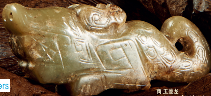
商 玉夔龙 长 9.5 cm (3 3/4 in)