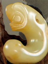
红山文化 玉猪龙 长 2.7 cm (1 in)