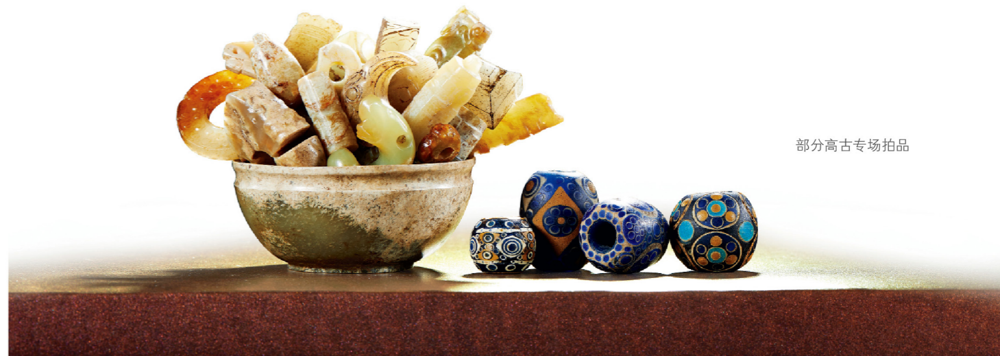
部分高古专场拍品